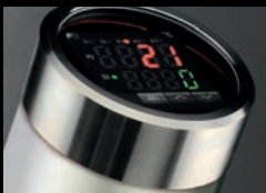
Control electrónico de la temperatura

Proceso de pintado estable en zonas con grandes cambios de temperatura entre noche-día, invierno y verano. Mejora del estiramiento de los barnices. Relé de estado sólido. Controlador de Temperatura P.I.D.