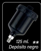
125 ml. ** Depósito negro