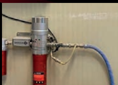
Incluye manguera de aire atemperada para un máximo aprovechamiento energético.