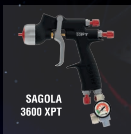
SAGOLA 3600 XPT